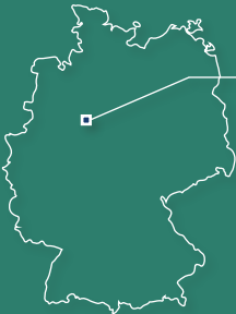
Bad Salzuflen, NRW

Zug: Bahnhof Bad Salzuflen, von dort ca. 10min zu Fuß