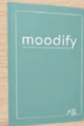
Janine Selle moodify

336 Seiten, kart. • € (D) 38,00 ISBN 978-3-95571-716-2 • Auch als E-Book